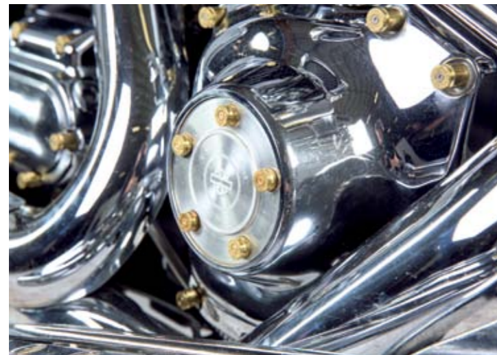
An allen Ecken und Enden verschönern Patronenhülsen das Bike. Die Kugeln haben die Custom-Hands-Macher höchstpersönlich verschossen