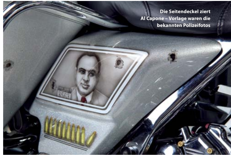
Die Seitendeckel zielt Al Capone – Vorlage waren die bekannten Polizeifotos